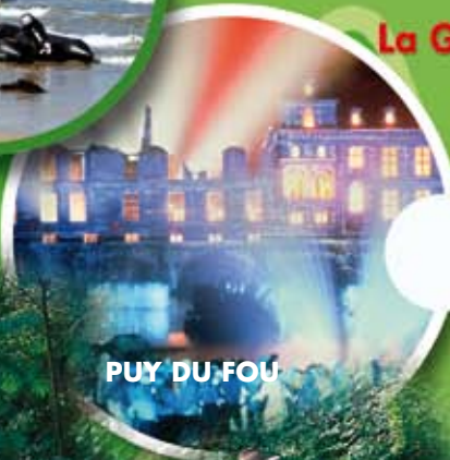
PUY DU FOU