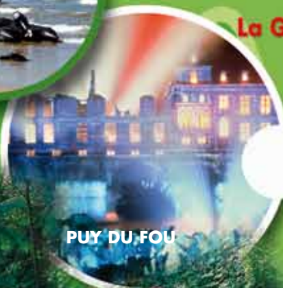
PUY DU FOU